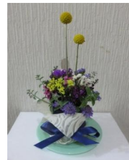
※フラワーアレンジメントのイメージ

場所：名古屋市役所本庁舎 正面出入口花壇 地下鉄名城線 名古屋城駅2番出口南 対象：小学生以上 ※小学生は保護者同伴 講師：花の国あいちガーデニング協会