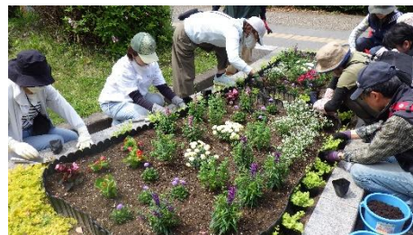
※今年4月の花壇植替の様子