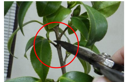
・枝や葉の元から芽が伸びるので、葉の上の位置で剪定する