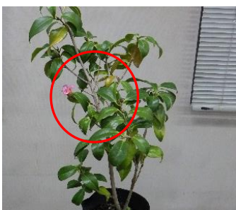
・このあたりを拡大してみる…