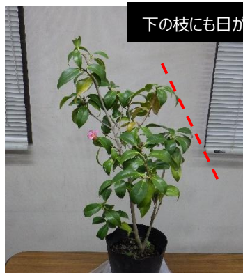
・横に広がる枝がある場合は、上の枝を下の枝より短めに剪定する