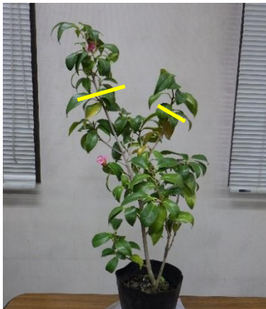
・高さを抑えたい枝を剪定する

春に枝が伸びる事を考え、高さを抑えたい枝、横に広がっている枝を剪定します。剪定した枝に葉がないとその枝は枯れてしまうので、枝に2, 3枚は葉を残します。