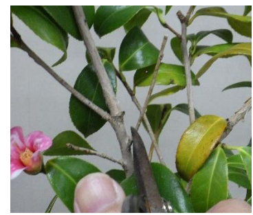
・枯枝を元から剪定する