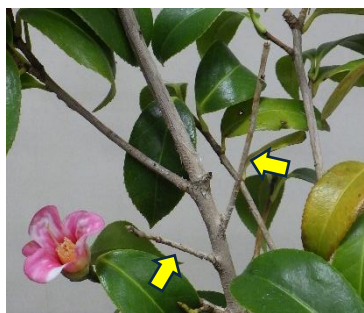
・混み合ったところに枯枝がある